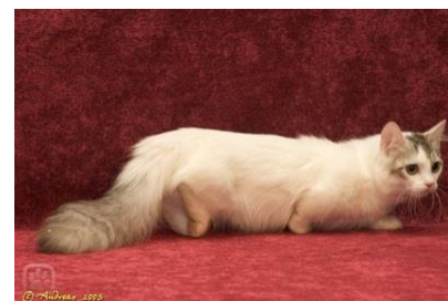
Klára Rajvová 7. A

Munchkin je plemeno kočky domácí s genovou mutací, díky které má kočka výrazně zkrácené nohy, podobně jako třeba u psů jezevčík. Z velkých chovatelských organizací plemeno uznává pouze TICA.