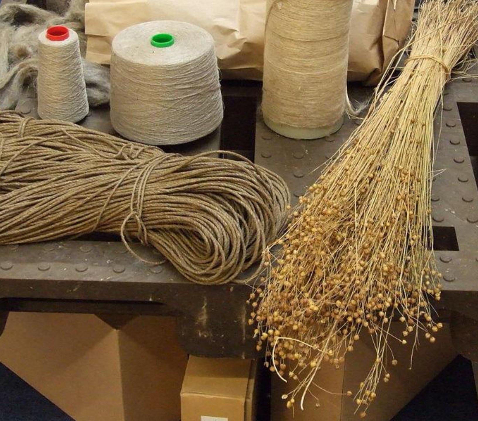
Usušený len a Iněné provazy.