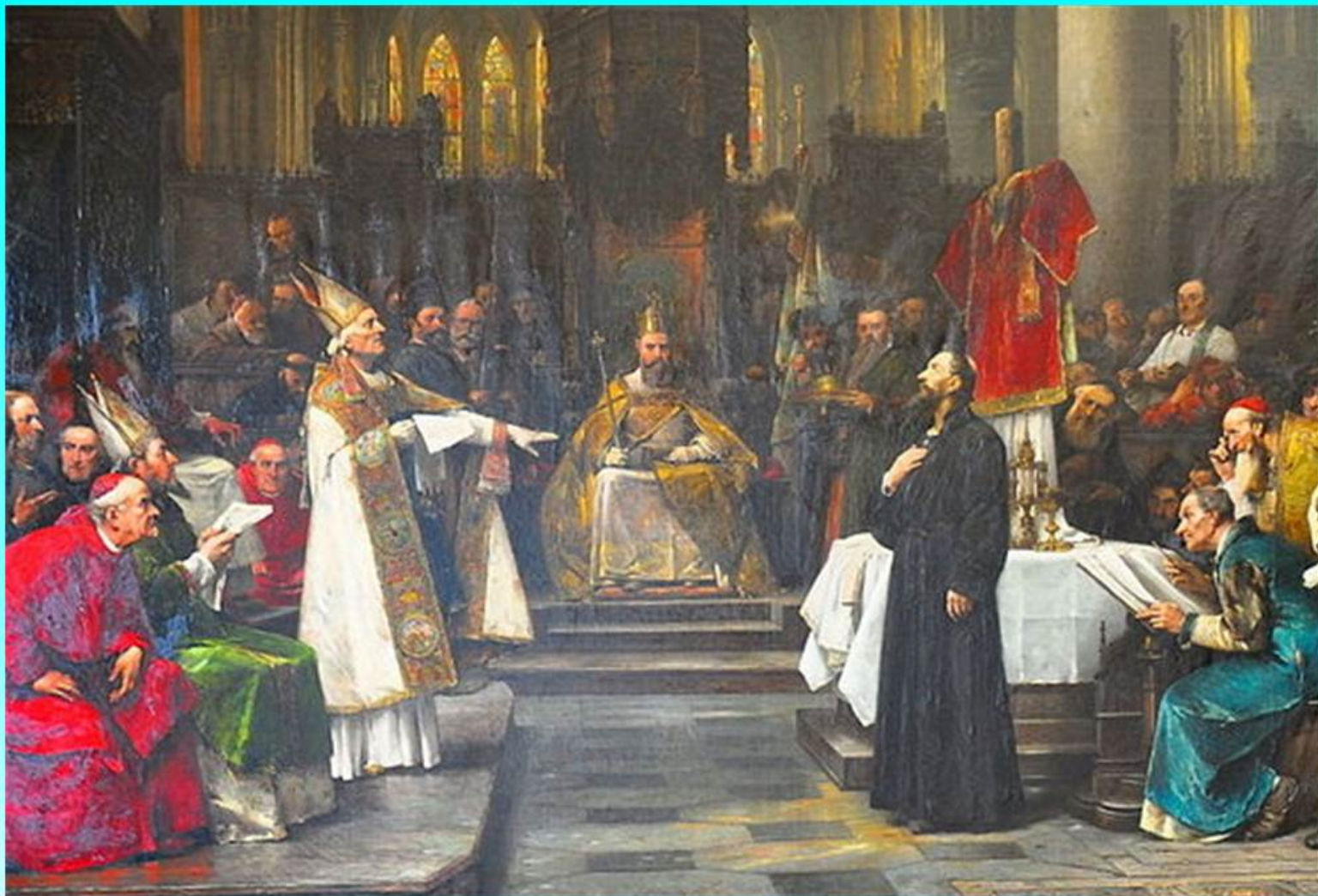
Jan Hus na sněmu v Kostnici