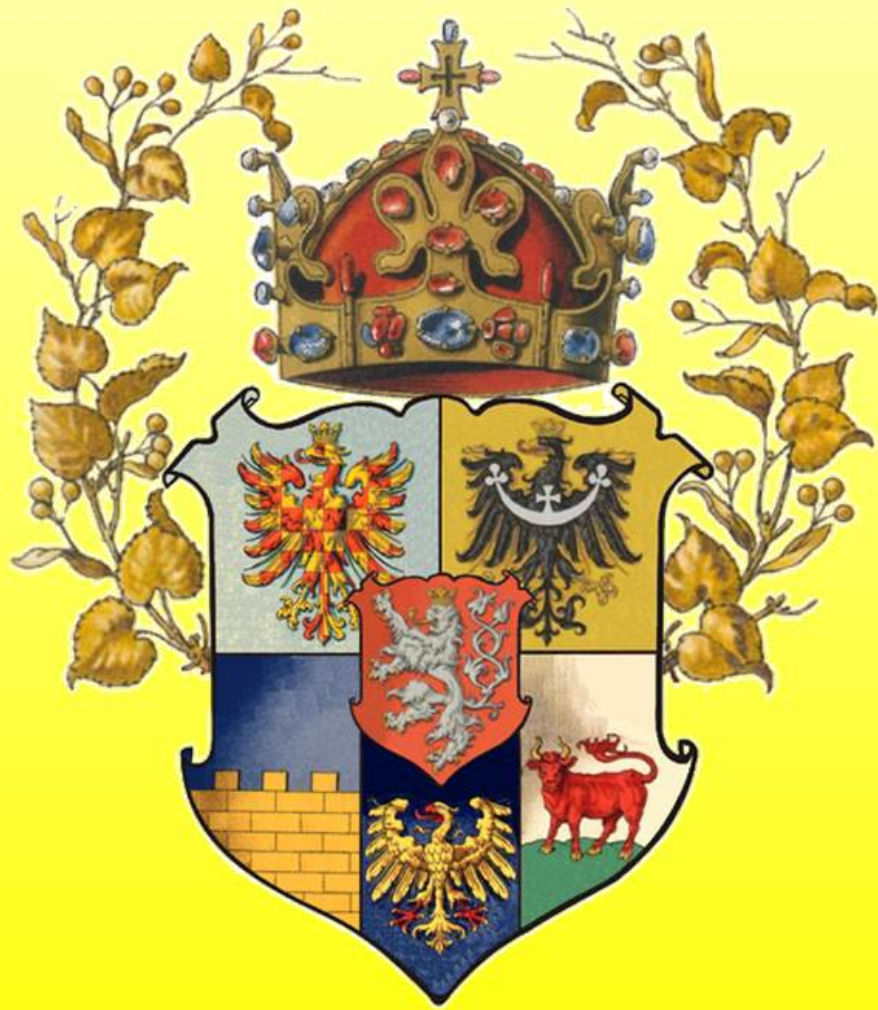
Znak Země Koruny české

Po husitských válkách byla česká země v hrozném stavu. Král Zikmund brzy zemřel a jeho vnuk Ladislav Pohrobek byl na vládnutí příliš malý.