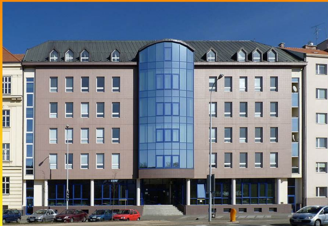
Pedagogická fakulta Masarykovy univerzity

V Brně je několik vysokých škol, na kterých studuje asi 90 000 studentů.