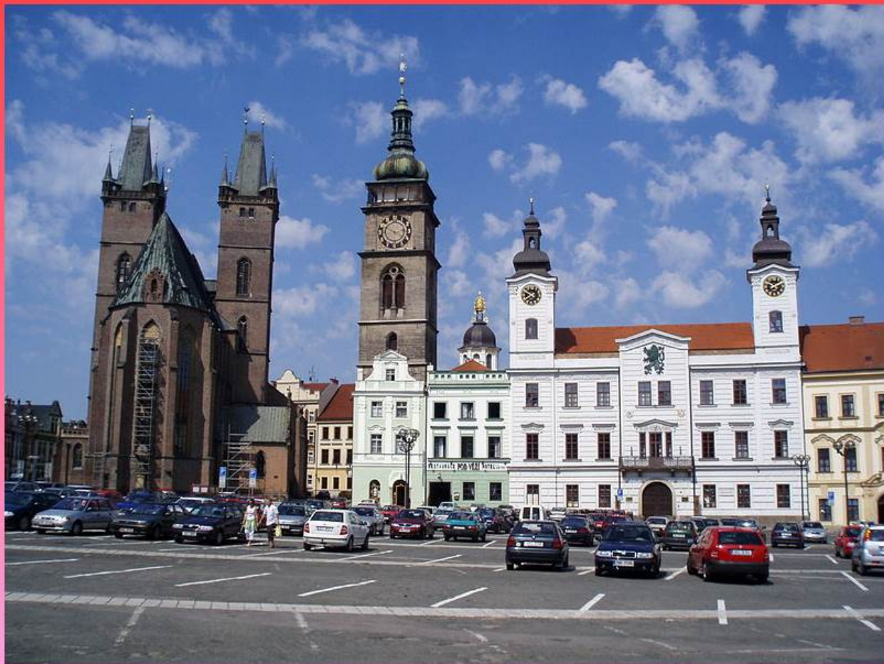
Chrám sv. Ducha, Bílá věž a bývalá radnice

Město má několik vysokých škol. Vyrábí se zde klavíry značky Petrof. Je zde hvězdárna a planetárium. Hradec Králové má velmi zajímavou architekturu, na které se podílel slavný architekt Josef Gočár.