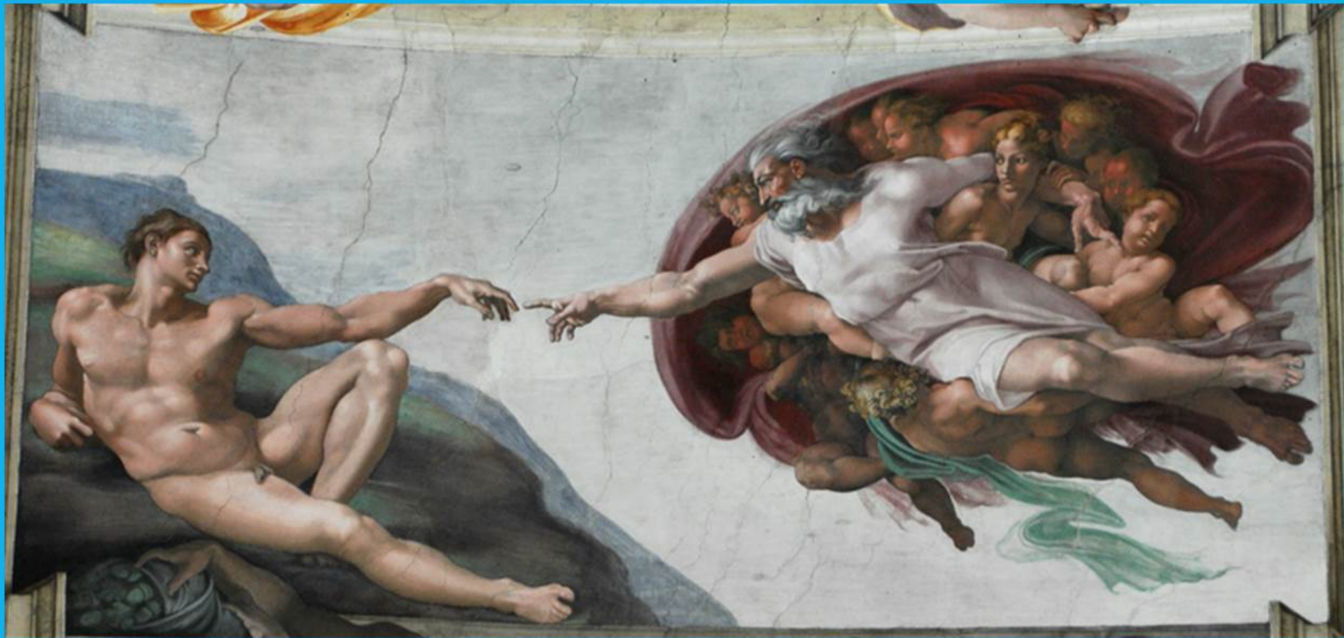
Michelangelo - Stvoření Adama (součást freskové výzdoby Sixtinské kaple ve Vatikánu)