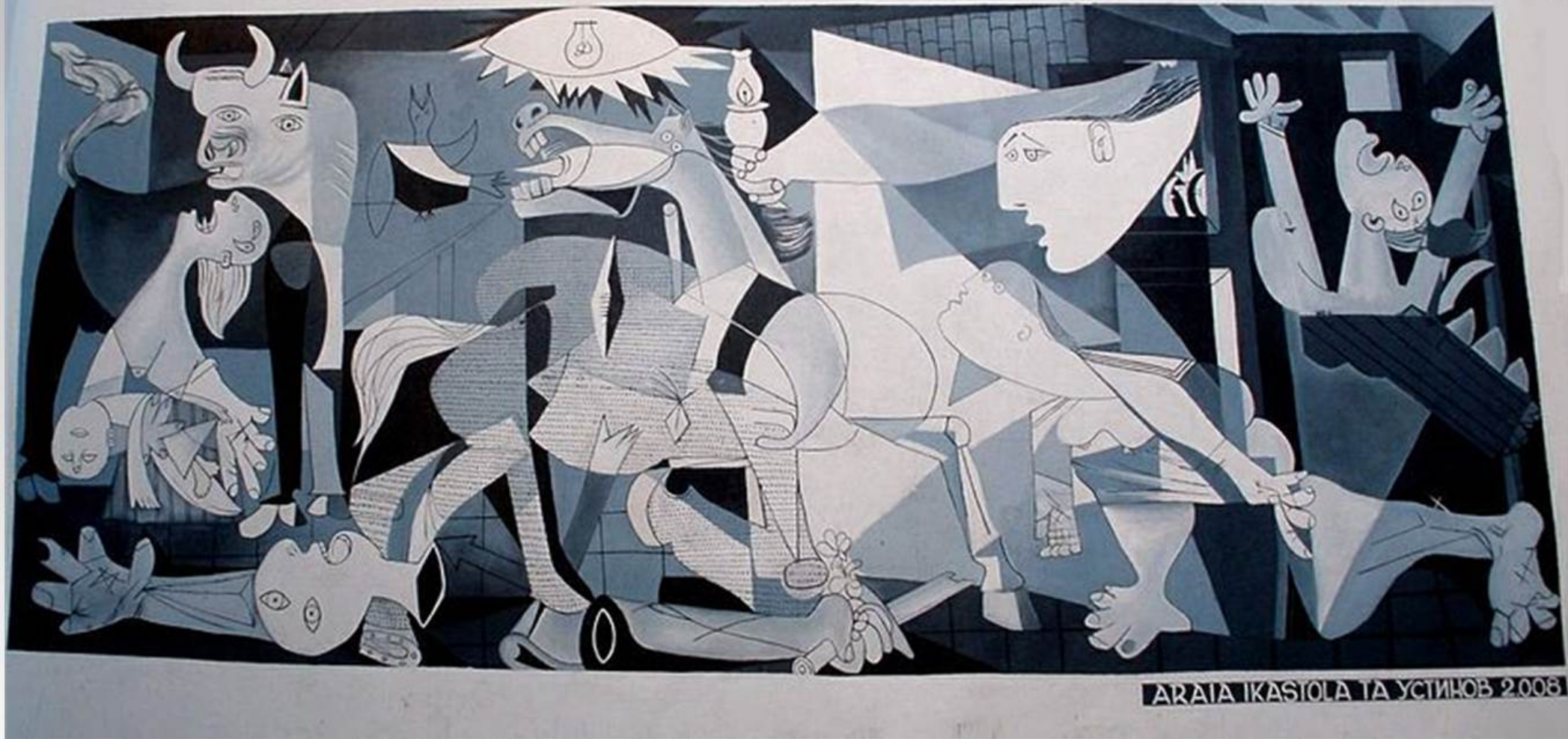
Picasso - Guernica, 1937