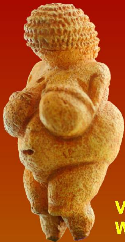
Venuše z Willendorfu