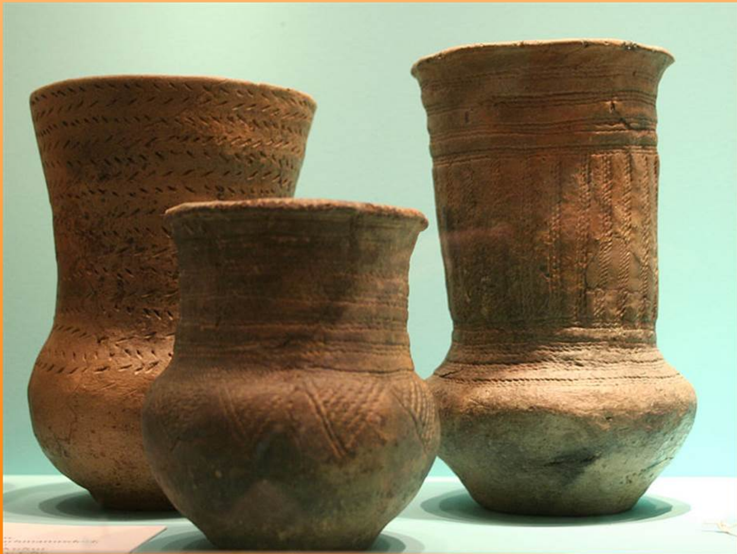
Vypíchaná a šňůrová keramika