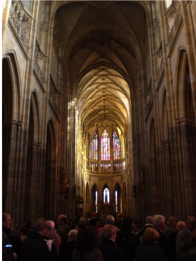
Katedrála sv. Víta zevnitř.

Jde o jednu ze dvou katedrál na našem území, jinak je tento styl staveb obvyklý ve Francii, odkud také přišel s Karlem IV. První stavitel ( Matyáš z Arrasu). Pokračoval český mistr Petr Parléř a dokončovala ji řada dalších.