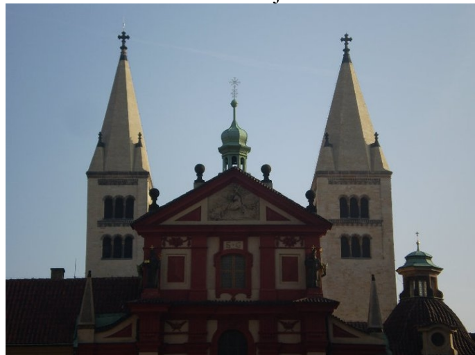
Bazilika sv. Jiří je nejstarším kostelem latinského obřadu v Čechách.

Jde o jednu ze dvou katedrál na našem území, jinak je tento styl staveb obvyklý ve Francii, odkud také přišel s Karlem IV. První stavitel ( Matyáš z Arrasu). Pokračoval český mistr Petr Parléř a dokončovala ji řada dalších.