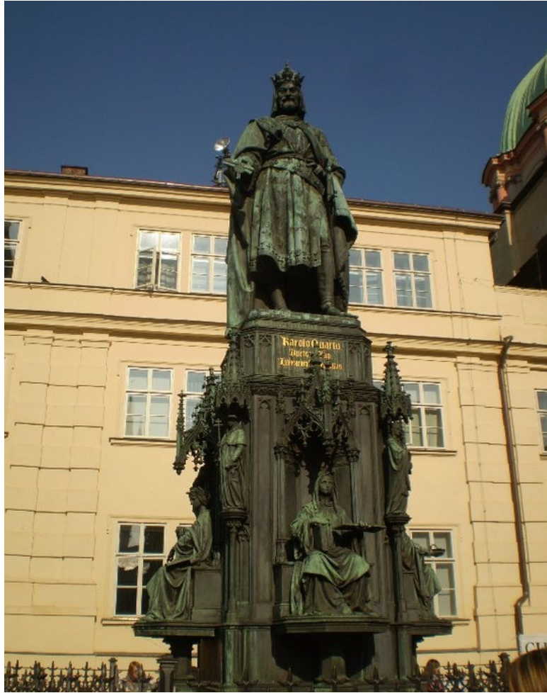
Socha Karla IV.

Karel IV. (14. Května 1316, Praha – 29. Listopadu 1378, Praha) byl jedenáctý český král (jako Karel I. – 1346–1378), lombardský král (1355), římský král (1346–1355) a císař (1355–1368). Arelatský král (1365) a hrabě lucemburský (1346 – 1353) z dynastie Lucemburků. Karel IV., křtěný jménem Václav , se narodil jako syn Elišky Přemyslovny a Jana Lucemburského. Vzdělání se Karlovi dostalo na francouzském dvoře, kde byl také oženěn s první ze svých čtyř manželek Blankou z Valois. Jako český král stál u zrodu Nového města Pražského a dal zbudovat Karlův most. Roku 1348. vydal zakládací listinu Karlovy univerzity. Na jeho popud byla zhotovena Svatováclavská koruna. Zanechal po sobě několik spisů, mezi nejznámější patří autobiografie Vita carovi .